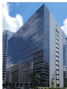
新大阪第一生命ビルディング (一部共有持分・追加)